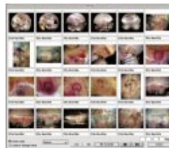
洞窟壁画ギャラリー