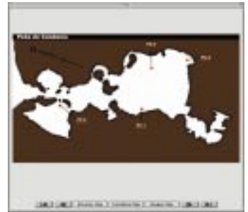
旧石器洞窟地図ウインドウ