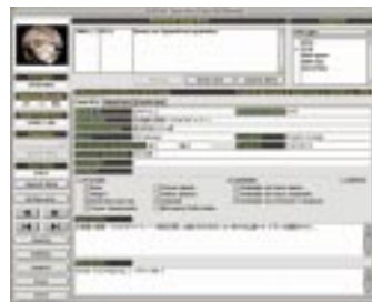
データウインドウ