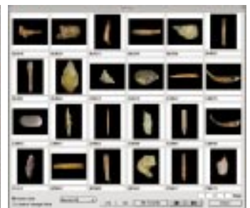
動産美術ギャラリー