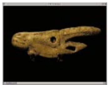
動産美術QTVRオブジェクトムービーウインドウ