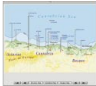
北スペイン旧石器洞窟遺跡地図

アルタミラ研究博物館収蔵動産美術 サンタンデル考古学博物館収蔵動産美術 ビルバオ考古学博物館収蔵動産美術 オビエド考古学博物館収蔵動産美術 サンセバスチャン考古学博物館収蔵動産美術