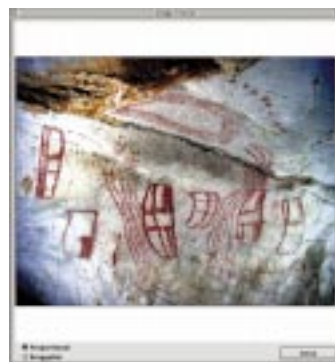
洞窟壁画JPEG画像ウインドウ